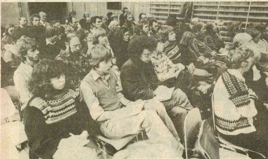
Salen i forsamlingshuset i Eikesdal var fullsatt under Mardøla-seminaret i helga.

I øsende regnvær — i likhet med under demonstrasjonen for ti år siden — gikk 30—40 av deltakerne på seminaret søndag opp fra Eikesdal til Sandgrovbotten søndag.