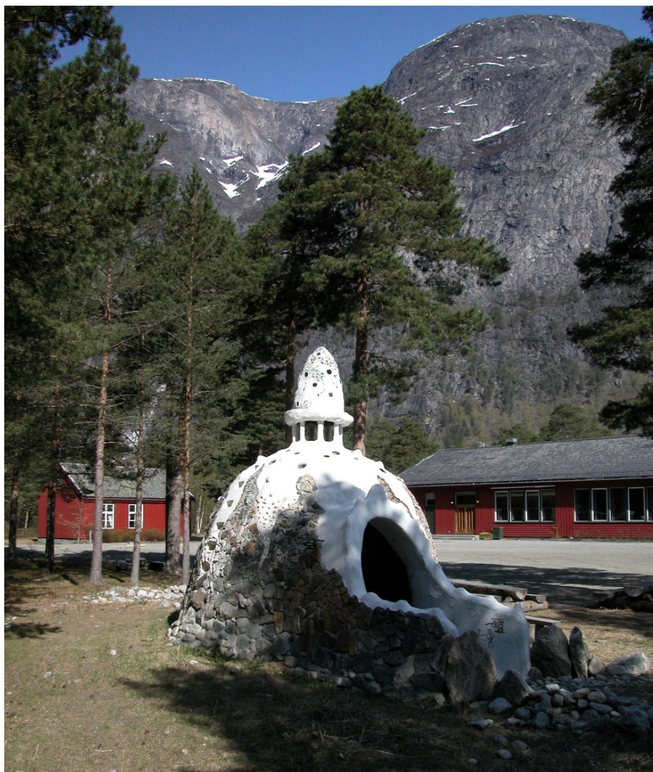
Eikesdal grendahus med lokal Gaudi-skulptur laga av skulebarna i framgrunnen.

På grunn av korona-situasjonen har vi hatt skriftleg påmelding fra alle som vil delta. Vi ber også alle som kjem om å ta ansvar og hjelpe oss med å begrense risikoen for smitte. Det vil bli plassert ut handsprit både i lokalet, på toalett etc. Seminaret er gratis, men det blir sal av drikke og lunsj i løpet av dagen.